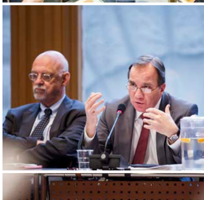
EU-nämnden håller ett öppet sammanträde i riksdagens Skandiasal. Vid sammanträdet samråder statsminister Stefan Löfven (S) med EU-nämnden inför ett möte i Europeiska rådet.